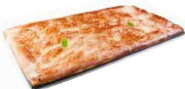
LLAUNA COCA CABELL D'ÀNGEL