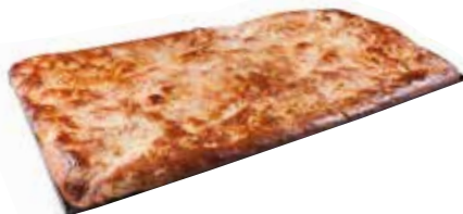
LLAUNA COCA D'AMETLLES