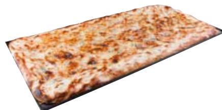
LLAUNA COCA DE XOCOLATA