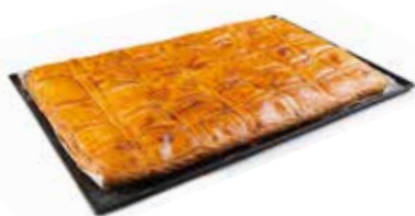
LLAUNA EMPANADA Tonyina i olives Tonyina i escalivada Coca de recapte amb anxoves Coca de recapte amb botifarra