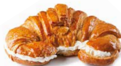
CROISSANT GEGANT nata | crema | trufa

1 Coca d'escalivada amb anxoves 1 Empanada de tonyina 1 Coca de ceba i botifarra 1 Coca de verdures amb formatge de cabra