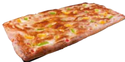
LLAUNA COCA DE FRUITA