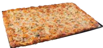
LLAUNA PIZZA Tonyina Pernil dolç Ou dur i ceba Bacon